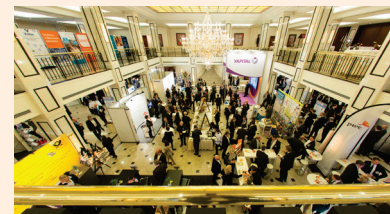
Kongressmesse Retail World