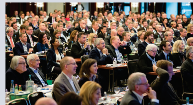
Kongressteilnehmer im Plenum

Bereits am Vorabend des Deutschen Handelskongresses laden die Veranstalter und Microsoft zu einem ersten Warm-up „Unter den Linden“ ein. Der Abend bietet neben inspirierenden Impulsvorträgen ausreichend Gelegenheit für ein erstes Kennenlernen.