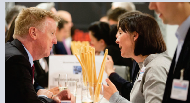
Networking beim Business Speed Dating